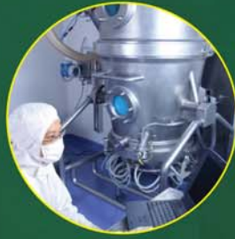
Farmacêutico e Bioquímica