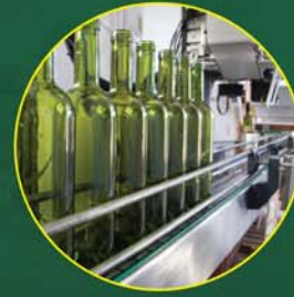
Alimentos e Bebidas