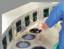
Serviços de Calibração