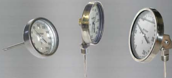
Ligar de volta Botão para conectar Ângulos Ajustáveis