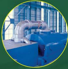
Geração de Energia