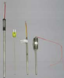
Grupo para Haste