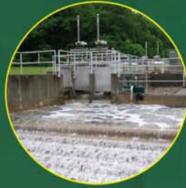
Água e Resíduos