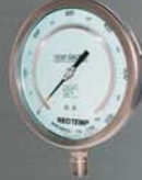
Teste de Precisão