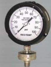
MS8 Indicador de Vedação