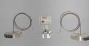
Grupo de Transmissores