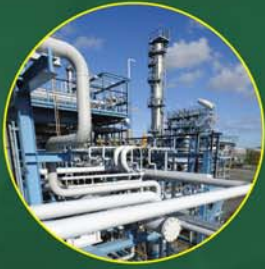
Petróleo e Gás