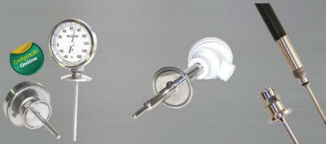
Termômetros Bimetais Grupo de Termorresistência ReoClick