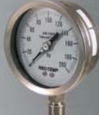
Todo Soldado SS