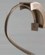
Área de Soldagem