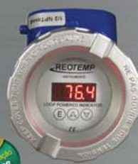
Z-Temp (À prova de explosão com display)