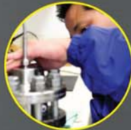
Padrão de Rastreamento NIST