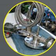
Grupos de Transmissores